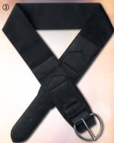
③ Audrina Belt Pasek Audrina Materiał: imitacja skóry, poliester, żelazo. Wymiary: 95 x 6,5 cm 23934