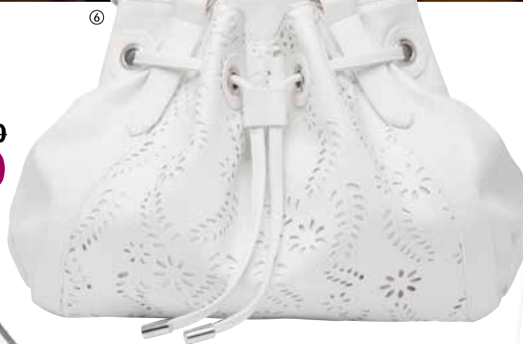
⑥ Flower Handbag Torebka Flower Wymiary: 27x34x135 cm 24998