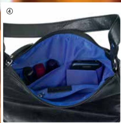
④ Audrina Bag Torebka Audrina Materiał: imitacja skóry, poliester, stop cynku, żelazo, nylon. Wymiary: 27 x 11,5 x 23 cm 23933